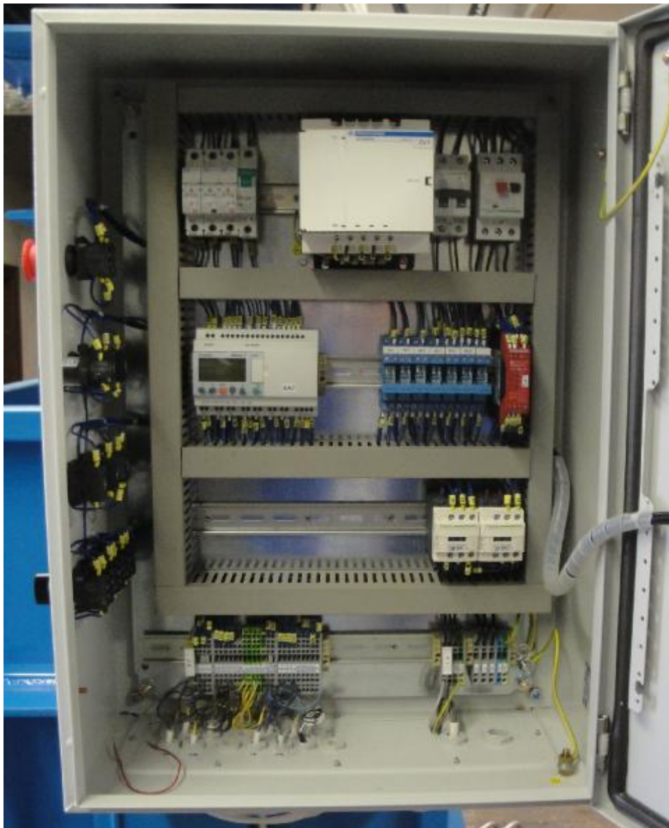
Uspořádání rozvaděče elektrovýbavy