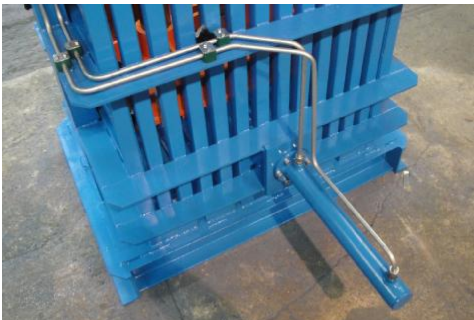
Vyhazovací hydraulický válec na zadní stěně komory