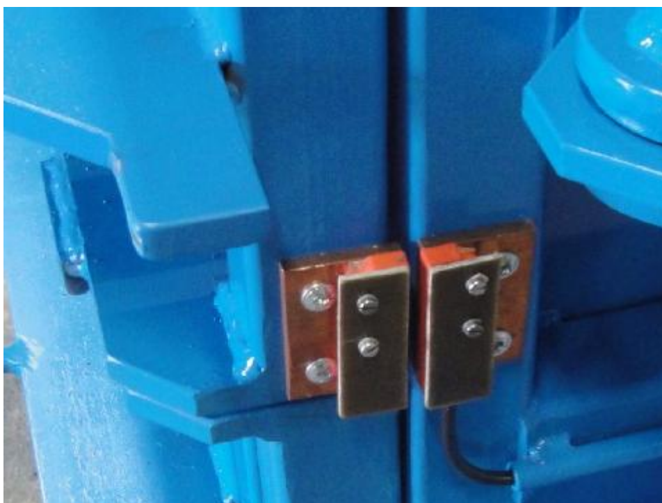
Kódovaný magnet kontroly uzavření dveří