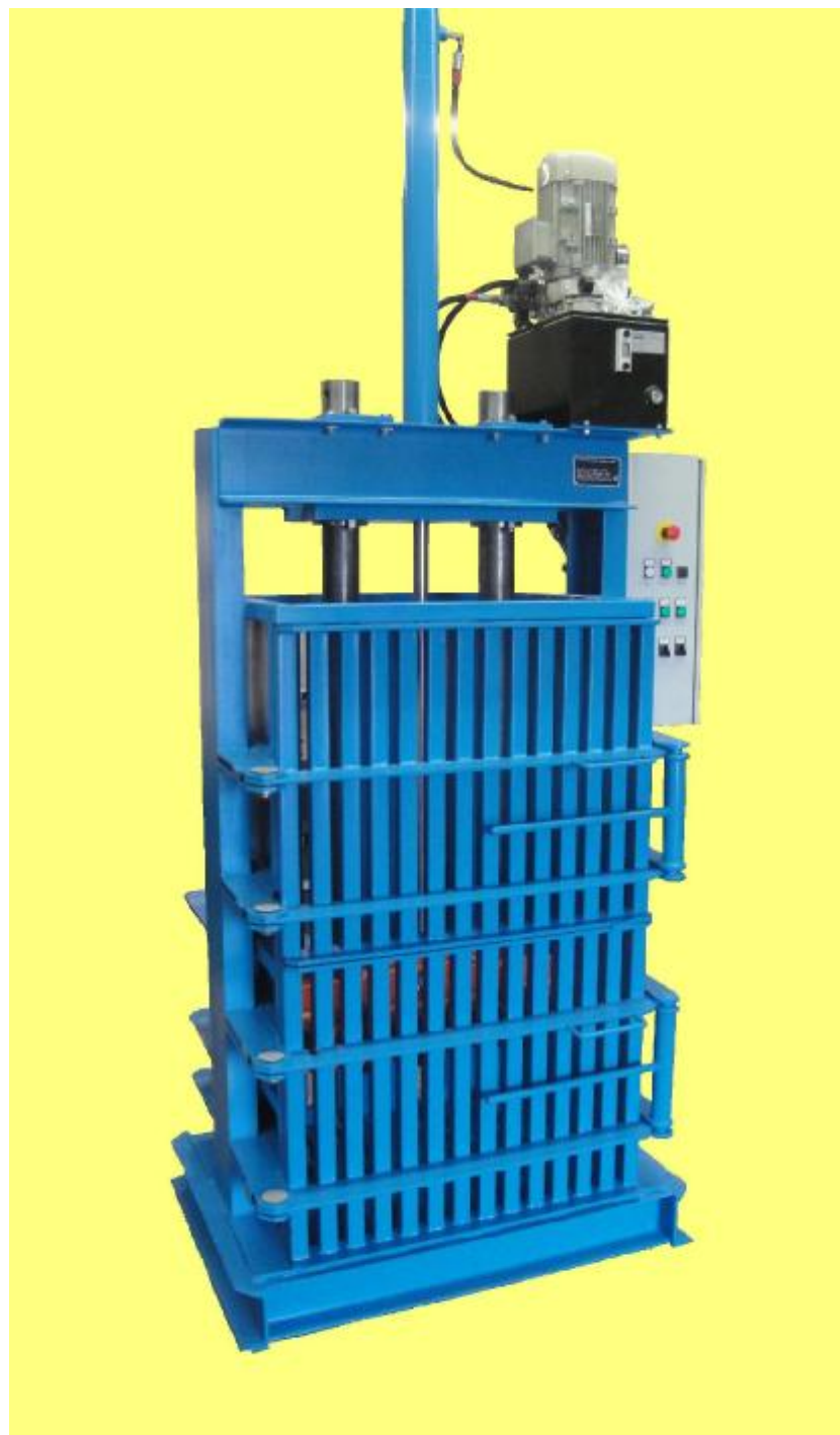
Hydraulický paketovací lis HPL 7